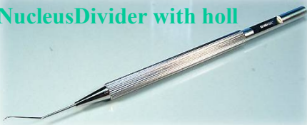
Nucleus Divider with holl