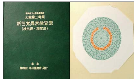
HP-1203 学校用色覚検査表・HP-1205 石原色覚検査表 国際版38表・HP-1207 新色覚異常検査表は