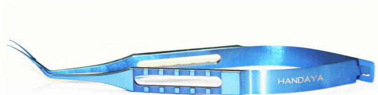
HS-9865B サーキュラー鑷子 (クロスアクション) クロスアクションタイプのCCC鑷子。全てチタニウム製にし、F-6215よりもハンドル部を幅広く扁平にデザインしており、持ちやすさが向上いたしました。 全長:105mm ¥75,000